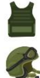
אפודים + קסדות