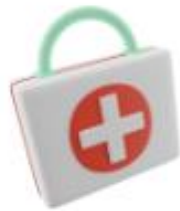
ציוד רפואי- ע"ר, אלונקות...